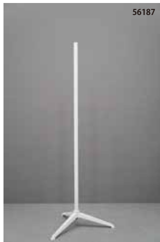
鋳物製 白 三脚 センタータイプ