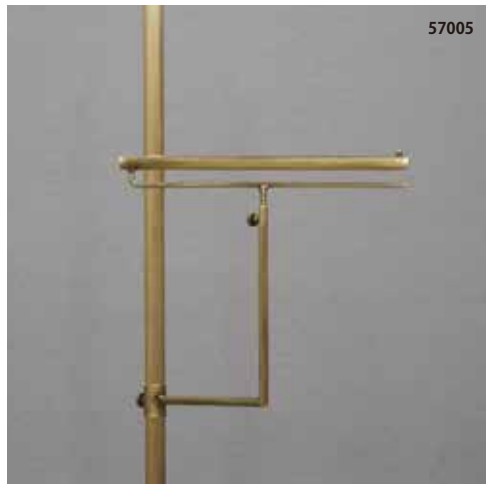
スラックス掛け可動タイプ 古美色