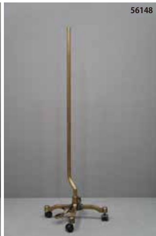
鋳物製 古美色 キャスター クランクタイプ