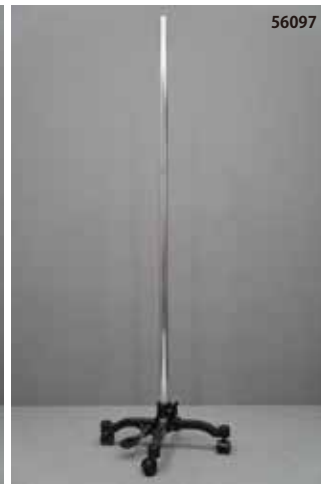
鋳物製 黒 キャスター センタータイプ