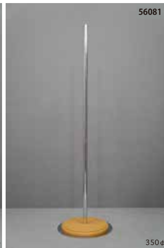
木製 クリア 丸 センタータイプ