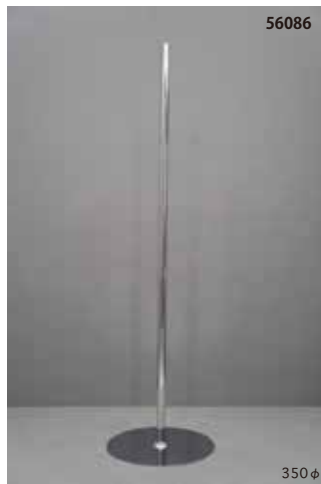
スチール製 クロームメッキ 丸 センタータイプ