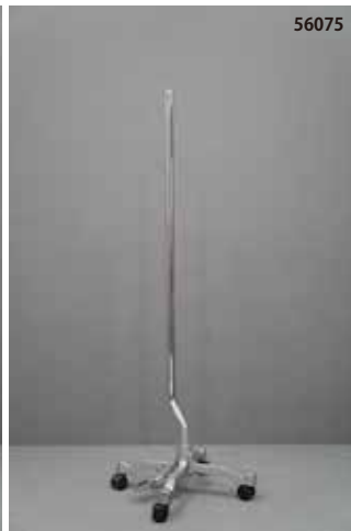
鋳物製 シルバー キャスター クランクタイプ