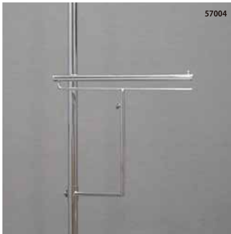
スラックス掛け可動タイプ クロームメッキ