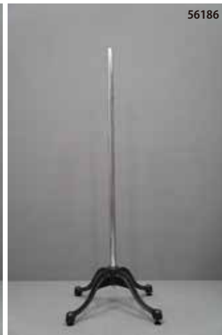
鋳物製 黒 四脚 センタータイプ