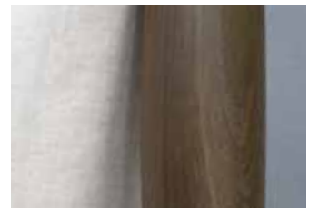
樹脂製 木目調 ブラウン