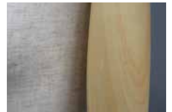
樹脂製 木目調 クリア