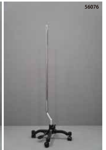
鋳物製 黒 キャスター クランクタイプ