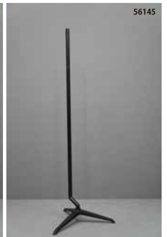
鋳物製 黒 三脚 クランクタイプ