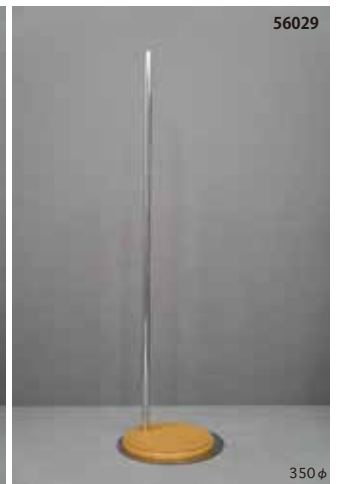
木製 クリア 丸 サイドタイプ