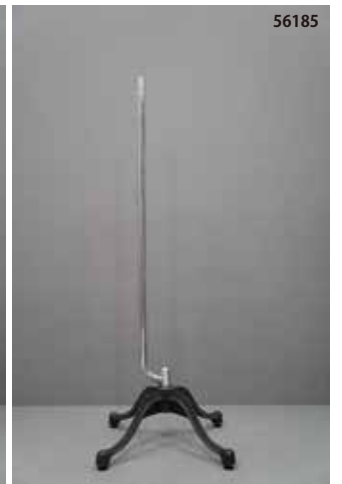
鋳物製 黒 四脚 クランクタイプ