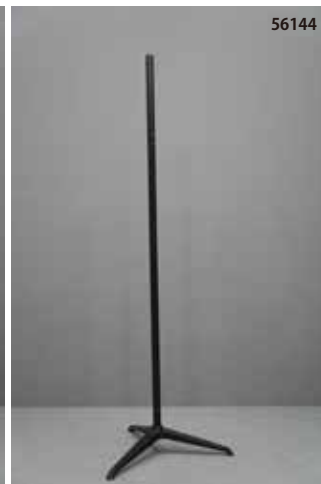
鋳物製 黒 三脚 センタータイプ