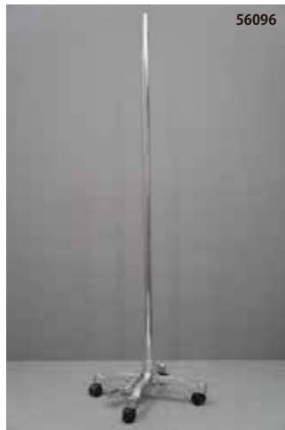
鋳物製 シルバー キャスター センタータイプ