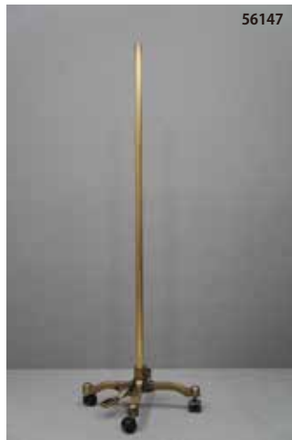
鋳物製 古美色 キャスター センタータイプ