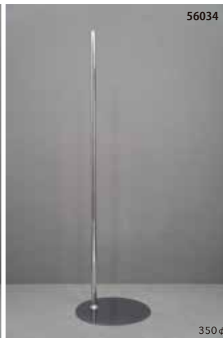
スチール製 クロームメッキ 丸 サイドタイプ