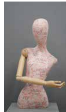
mim-02.C 木腕 10387 55014