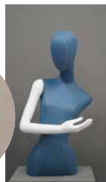
mim-02.B FRP-1 腕 10386 10388