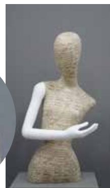
mim-02.A FRP-1 腕 10385 10388