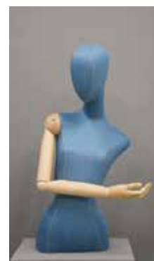
mim-02.B 木腕 10386 55014