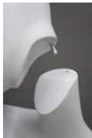
neck joint part