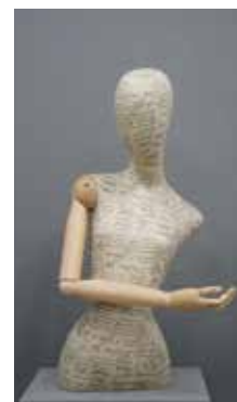
mim-02.A 木腕 10385 55014