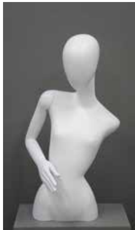
mim-01.A TH81.5/B75/W44/H83 Wide41/deep37cm 10380