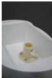
sole joint part