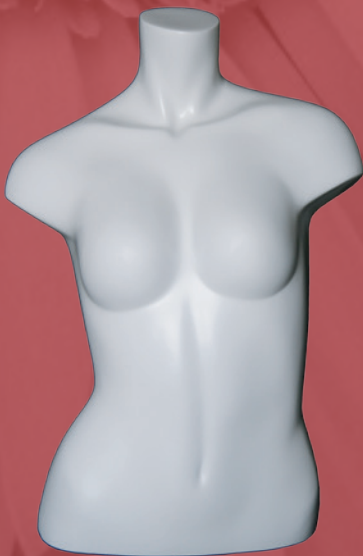
ER-01 *スタンド・置式共通仕様