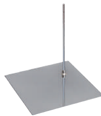
外部安定スタンド ストレート W40.0/D40.0