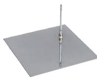
底安定スタンド W40.0/D40.0 56006