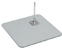
ガラスベース W40.0/D40.0 56003