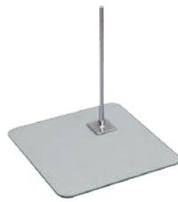
ガラスベース ストレート W40.0/D40.0