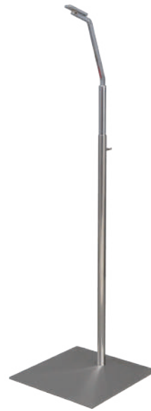
背中安定スタンド W35.0/D35.0 56007