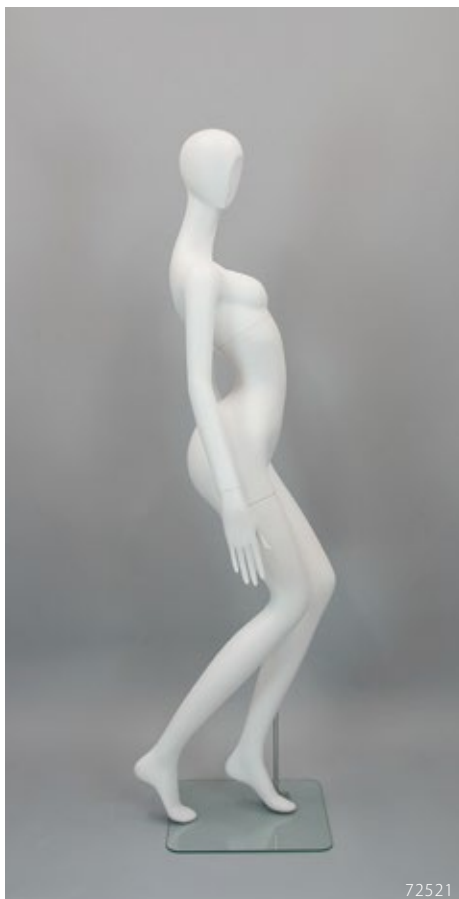
PL-203.01 T:172 B:78 W:46 H:85