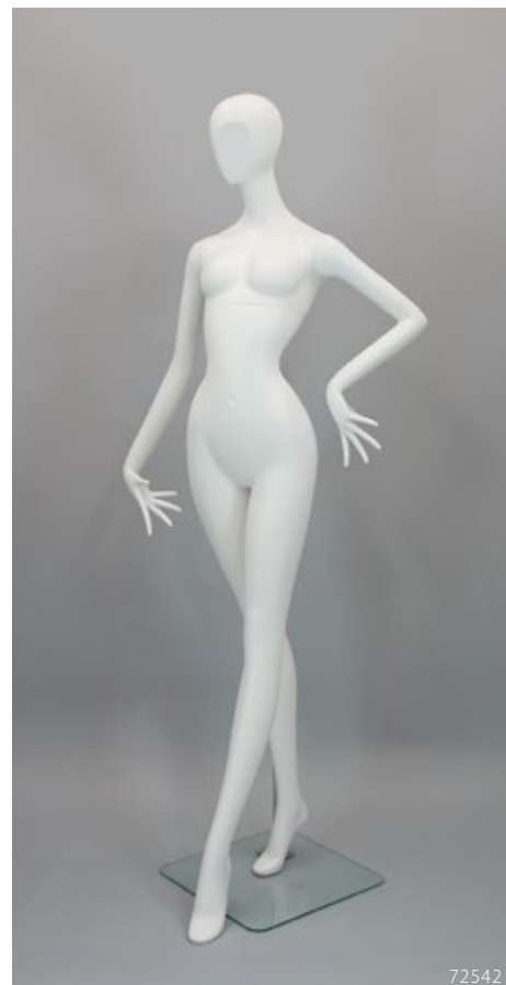
PL-205.02 T:181 B:78 W:46 H:85