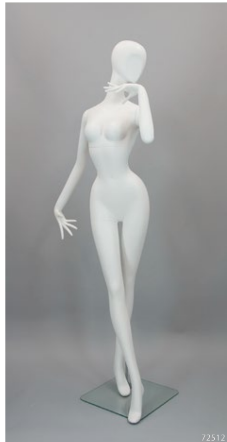
PL-202.02 T:184 B:78 W:46 H:85