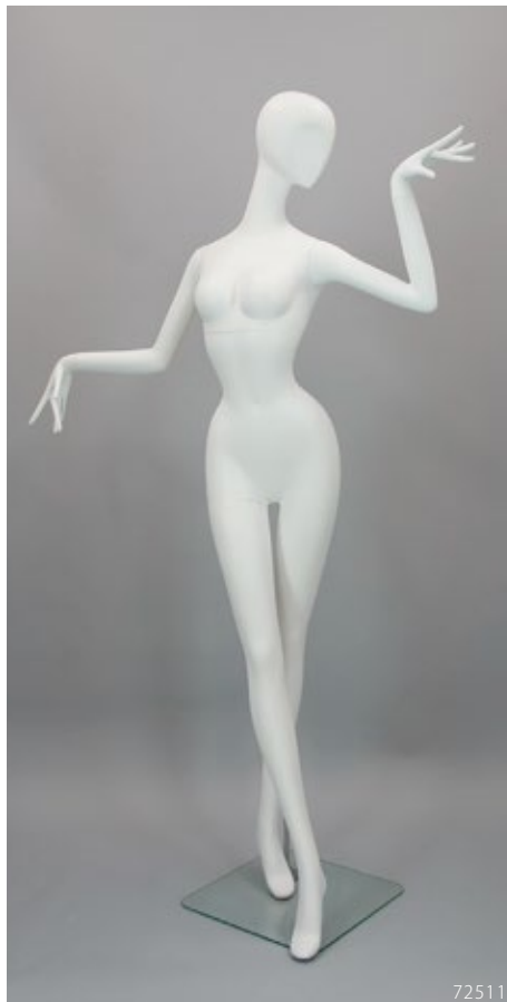
PL-202.01 T:184 B:78 W:46 H:85