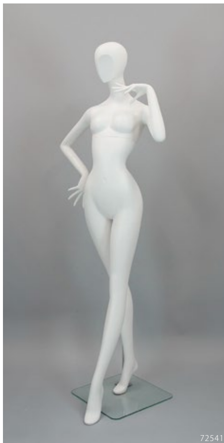
PL-205.01 T:181 B:78 W:46 H:85