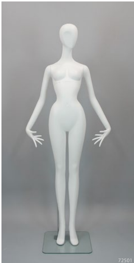
PL-201.01 T:182.5 B:78 W:46 H:85