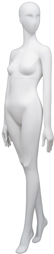
au-015.BS-E-01 T182.0/B81.0/W60.0/H88.0 ShoesSize23.5 71893