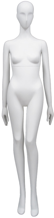
au-014.BS-E-01 T183.5/B80.0/W61.0/H87.0 ShoesSize23.5 71886