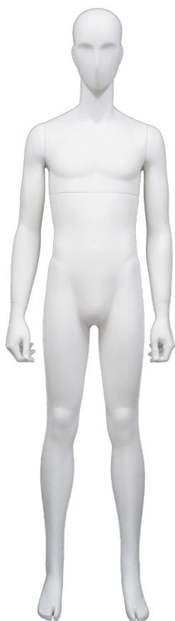
aum-101.BS-A T183.0/B86.0/W71.0/H89.0 ShoesSize26.0 61670