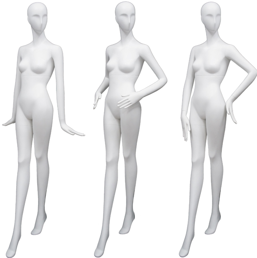
au-012.BS-A T182.0/B81.0/W60.0/H88.0 ShoesSize23.5 71871