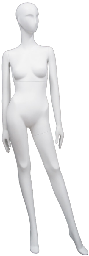
au-011.BS.SD-E-01 T182.0/B80.0/W59.0/H86.0 ShoesSize23.5 71851