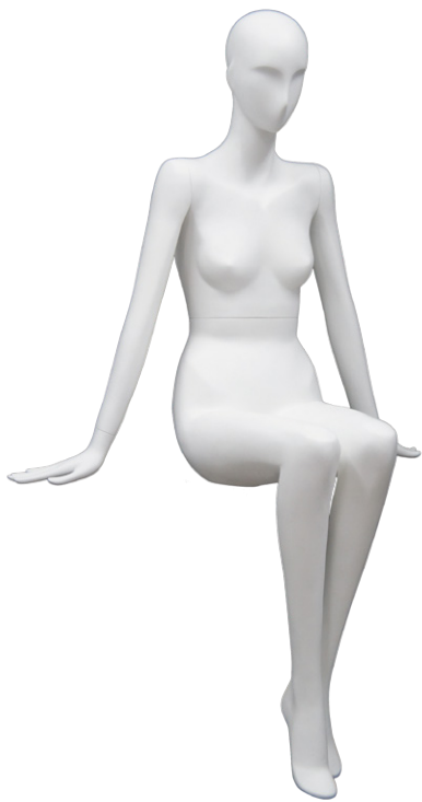
au-013.S-A B81.0/W61.0/chair height53.0~ ShoesSize23.5 71881