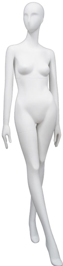
au-012.BS.SD-E-01 T182.0/B81.0/W60.0/H88.0 ShoesSize23.5 71876